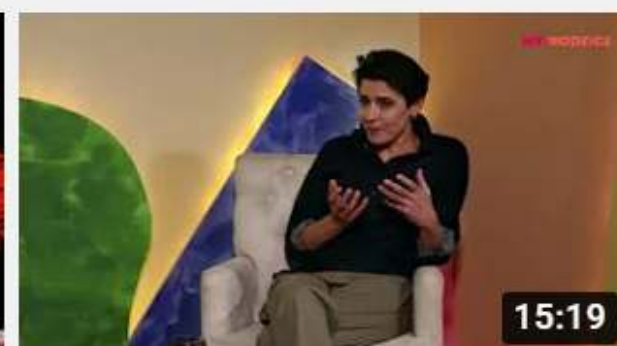
Projekt My Rodzice - Granice i zasady