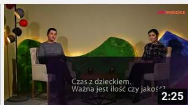
Projekt My Rodzice - Jakie znaczenie ma czas z...