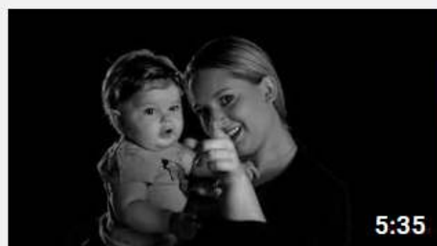
Projekt My Rodzice - Co mówią dzieci, kiedy nic nie...