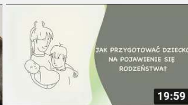
Projekt My Rodzice - Kolejne dziecko w rodzinie