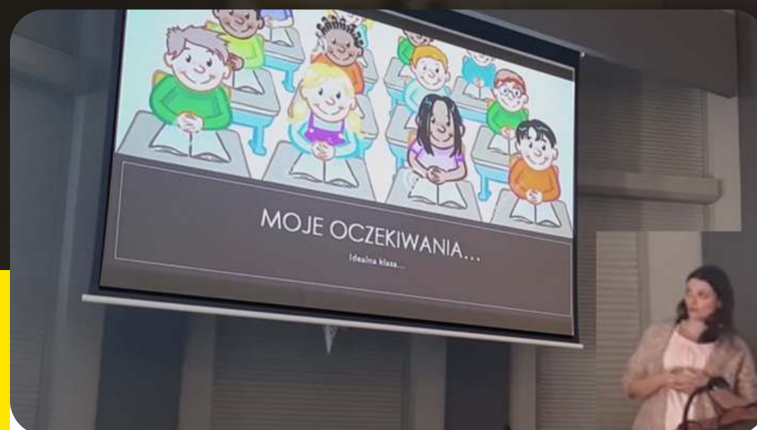
Konferencja podsumowująca projekt 2019 r.

Czy to doświadczenie zmieniło ich pracę?