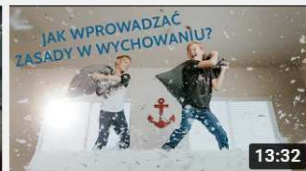
Projekt My Rodzice - Jak wprowadzać zasady w...