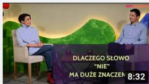
Projekt My Rodzice - Świadome NIE