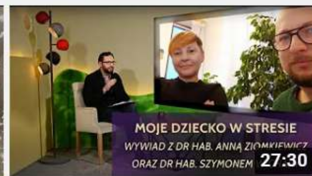
Projekt My Rodzice - Moje dziecko w stresie