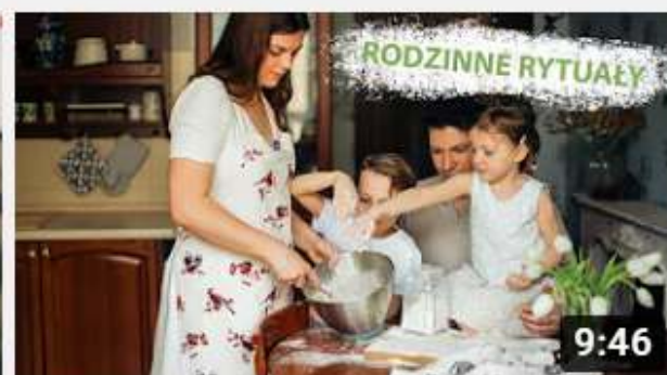
Projekt My Rodzice - Rytuały w rodzinie