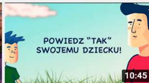
Projekt My Rodzice - Świadome TAK