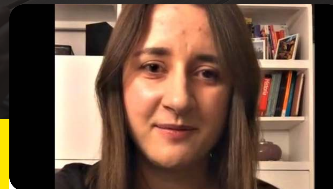
Wypowiedzi absolwentów Warszawa 2021 r.