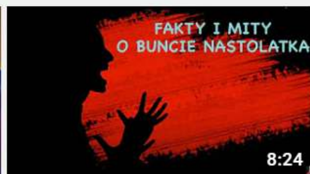
Projekt My Rodzice - Fakty i mity o buncie nastolatka