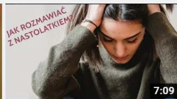
Projekt My Rodzice - Jak rozmawiać z nastolatkiem?